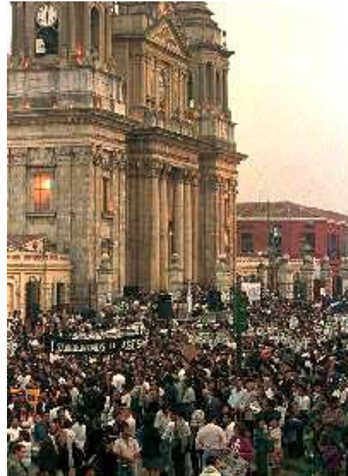
Acción de la Iglesia